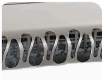
CUPULA PROTECTORA INOXIDABLE EXCLUSIVA SAYL